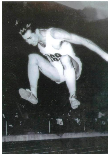
A „repülő ember” új csúcst ér el

1956 telén tüdőgyulladást kaptam, nem tudtam rendesen fölkészülni a Melbourne-i olimpiára. Kivittek, de nem ment a versenyzés, kiestem. 1959 őszén szerepeltem utoljára a válogatottban, majd a sok betegeskedés, sérülés miatt 1960-ban visszavonultam.